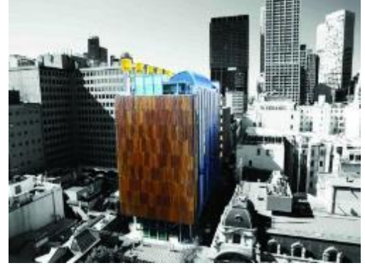
Şekil 6. Council House 2 Ağaç Kabuğu Gibi Tasarlanan Cephesi [14]

Binanın tasarımı, bir ağaç kabuğundan etkilenmektedir. Sürdürülebilirlik ve bina tasarımına geleneksel yaklaşımlara meydan okuduğu için yenilikçi ve enerji tasarrufu sağlayan biyomimik bir tasarımdır. Bina Yeşil derecesi 6'dır. Council House 2'nin amacı, binanın dış çevreye ve onu çevreleyen yaşayan organizmalara bağlanması temel alınmıştır.