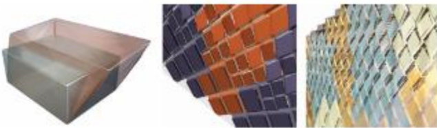
Şekil 10. Kertenkele Derisinden Esinlenen Yapı Kabuğu [16]

Iaria Mazzoleni önderliğinde 2011 yılında analiz edilen bir tür kertenkelenin fiziksel özelliğinin kullanılmasıyla yeni bir yapı kabuğu tasarlanmıştır.