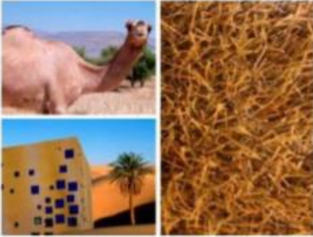
Şekil 9. Deve Derisi ile Yalıtım Çözümü [1]

Linda Hidebrand tarafından tasarlanan deve cephede ise, devenin aşırı sıcaklara karşı vücut örtüsünü koruması ve sıvı kaybına karşı geliştirdiği sistemleri dikkate almaktadır. Kılların parlak renkleri güneş ışığının büyük bir bölümünü yansıtırken, kıllardan oluşan vücut örtüsü gün boyunca sığağa karşı, gece boyunca da soğuğa karşı yalıtım sağlamaktadır [1].