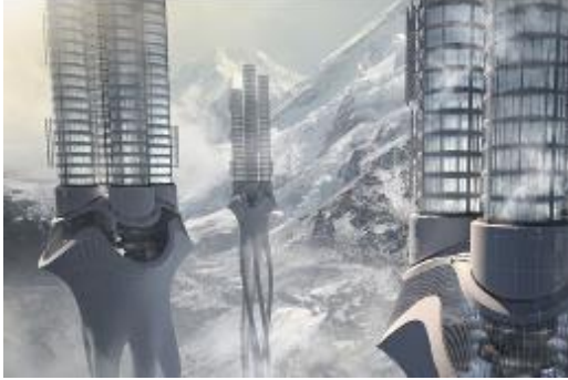
Şekil 13. Himalaya Su Kulesi [19]

Uygulanmamış örnek olan Himalaya Su Kulelerinin alt kısımları altı köklere benzeyen borulardan oluşmakta, bunlar dönerek ve birlikte suyu toplamakta ve depolamaktadır [4]. Gülay Yedekçi'ye (2016) göre, bir ağacın kökleri gibi bu borular en büyük su miktarını depolayacak şekilde büyümektedir. Binanın üst kısmı ise donmuş suyu depolamak için kullanılmaktadır. Dört masif gövde, çelik silindirik biçimleri taşımakta, aşağıdaki kökler gibi katmanları buzları depolamak için kullanılmaktadır.