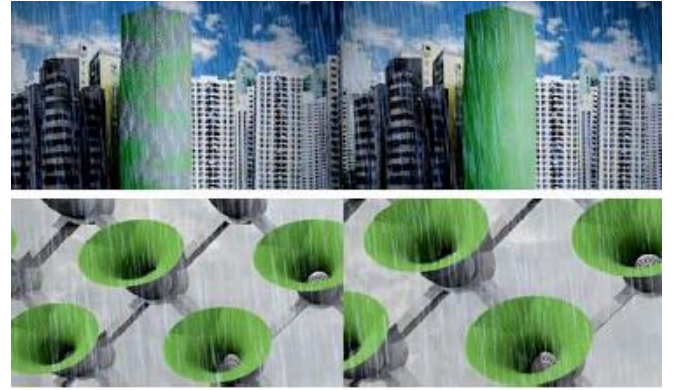
Şekil 11. Habitat 2020 Cephesi [17]

Uygulanmamış örneklerden olan Çin için tasarlanan Habitat 2020 binası doğal organizmalar gibi çalışan yaşayan yapılar oluşturmak için temel hücresel işlevlerle yüksek teknoloji fikirleri birleştiren ileriye dönük biyomimik mimarinin bir örneğidir. Kente doğadan ilham veren yaklaşım, kentsel peyzajı dinamik ve sürekli gelişen bir ekosistem olarak görülmektedir. Bu şehir içerisinde binalar, çevreye göre açılır, kapanır, nefes alır ve her türlü duruma göre uyulanır. Habitat 2020 binası, bir yapının yüzeyinin algısını kökten değiştirir. Dış yapı, sadece inşaat ve koruma için kullanılan bir malzemeden ziyade canlı bir cilt olarak tasarlanmıştır. Deri, habitatın dış ve iç kısmı arasında bir bağlantı görevi gören bir zar gibi davranır. Alternatif olarak, deri, gaz değişimi ve bitkilerde birkaç stoma hücresi açıklığına sahip yaprak yüzeyi olarak düşünülebilir. Yüzey, ışığın, havanın ve suyun girmesine izin verir. Güneş ışığına göre kendini otomatik olarak konumlandırır ve ışığın içine girer. Hava ve rüzgar, binaya yönlendirilecek, temiz hava ve doğal hava koşullandırma sağlamak için filtrelenecektir. Aktif deri, yağmur suyu toplama kapasitesine sahip olacaktır. Amaç saflaştırmak, süzmek, kullanılarak yeniden geri dönüştürülmüş hale getirmektir. Cilt, nemi havadan bile emebilir. Üretilen atık, habitatteki çeşitli kullanımlara sunulabilecek olan biyogaz enerjisine dönüştürülecektir.