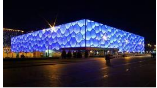
Şekil 2. Water Cube [11]

Water Cube olarak bilinen Beijing National Aquatic Center 2004 – 2007 yılları arasında 2008 yılı olimpiyatları için inşa edilmiştir. Bina Chriss Boss, Tristram Carfrae, PTW Architects, CSCEC, CCDL ve Arup tarafından tasarlanmıştır [10]. Tasarım aşamasında biyomimikri ile doğadan ilham alan bu yapı sabun köpüğü şeklinde yapılmıştır. Burada amaç bina kabuğunda enerjinin verimli kullanılabilmesi için güneş enerjisini emmesi hedeflenmiştir. Baloncuklardaki sabun filmleri yüzey alanını ve yüzey enerjisini azaltma özelliğine sahiptir. Çünkü bölümlerin yüzey gerilimi kabarcıkların yüzey alanını azaltır.