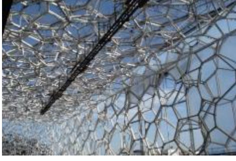
Şekil 3. Water Cube Binasının Geometrik Yapısı [11]

Çevresel olarak elde edilen sonuçlara göre, enerji verimli bir tasarım elde etmesine ve biyomimik bir yaklaşım uygulayarak tüm zorlukların ve hedeflerin üstesinden gelmesine neden olan birçok çevresel sonuca ulaşmıştır. Harcanan enerji maliyetleri %30 oranında azaltılmıştır. Tüm çatıyı güneş panelleriyle kaplamaya eşdeğer enerji tasarrufu yapılmaktadır. Güneşten gelen enerjinin %20'si tutulmaktadır. %55 oranında yapay aydınlatma azaltılmakta ve doğal aydınlatmaya yer verilmiştir. Yağmur suları filtre edilip toplanarak geri dönüştürülmektedir [12].