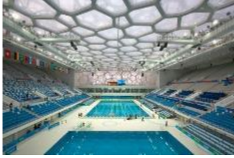
Şekil 4. Water Cube Binanın İç Mekanı [11]

Çevresel olarak elde edilen sonuçlara göre, enerji verimli bir tasarım elde etmesine ve biyomimik bir yaklaşım uygulayarak tüm zorlukların ve hedeflerin üstesinden gelmesine neden olan birçok çevresel sonuca ulaşmıştır. Harcanan enerji maliyetleri %30 oranında azaltılmıştır. Tüm çatıyı güneş panelleriyle kaplamaya eşdeğer enerji tasarrufu yapılmaktadır. Güneşten gelen enerjinin %20'si tutulmaktadır. %55 oranında yapay aydınlatma azaltılmakta ve doğal aydınlatmaya yer verilmiştir. Yağmur suları filtre edilip toplanarak geri dönüştürülmektedir [12].