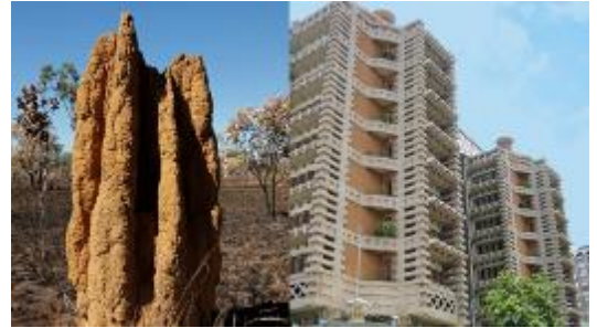
Şekil 7. East Gate Binası ve Termit Kuleleri [15]

East Gate Ofis Binası 1996 yılında Zimbabve'de yapılmıştır. Mimarisi Mick Pearce, mühendisliği Arup tarafından gerçekleştirilen ofis ve konut binasında, termit kuleleri taklit edilerek yapılan doğal havalandırma sistemi kullanılmaktadır kaynak. Termitler toprak altında değil üstünde devasa yuvalar kurmaktadır. Termit kulelerinde bulunan iklimlendirme ve havalandırma sistemlerinin, insanların yaptığı sistemlerden çok daha ileri bir konumda olmaktadır. Hava akımına aşırı duyarlı oldukları için kusursuz bir havalandırma sistemi yaparlar. Bu bina termitlerin oluşturduğu tümseklerin model alınmasıyla tasarlanan dünyanın ilk doğal soğutmalı binası olmaktadır. Termit tümsekleri, yanlarında alçak hava basıncı barındıran bacalara sahip ve bunlar sayesinde hafif rüzgarları rahatlıkla içlerine alabilmektedirler. Termitlerin açtığı tünel yardımıyla sıcak hava yapıdan dışarı çıkmakta ve bu yolla yuvanın soğuması sağlanmış olmaktadır. Bu sistem ilk beş yılında $3,5 milyon dolarlık enerji tasarrufu sağlamıştır [15].