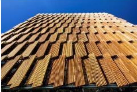
Şekil 5. Council House 2 Cephesi [14]

The Council House 2 Melbourne, Avustralya'da 10 katlı sürdürülebilir bir yapıdır. 2004- 2006 yıllarında inşa edilen yapı Mick Pearce tarafından tasarlanmıştır [13].