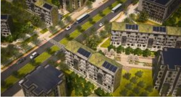
Şekil 1. İTÜ Eskişehir Kocakır Ekokent Projesi,2016 [8]

ise %70'e varan azalma sağlanabilmektedir. Ayrıca yeşil bina yapımlarında yatırımcıların iş süreçlerindeki kazanç sağlamaktadır. Bunlar %8-9 işletim harcamalarında tasarruf, %7 bina değerindeki artış, %6,6 yatırımın geri dönüşündeki artış, %42 enerji giderlerinde düşüş olarak tespit edilmiştir [4].