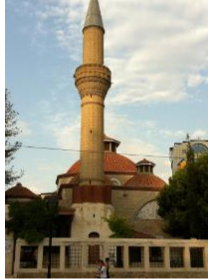
Şekil 5 Antalya Karakaş Camii [13]

Bu anlayışı ile geçmişteki var olan değerleri unutturmamak adına yapılarında tarihselliğini ve kültürü ön plana çıkardığı görülmektedir. Yapım tekniği olarak el yapımı işçiliklere önem verilmiştir. Kubbe yıkılmış camideki gibi kiremitlerden oluşmaktadır.