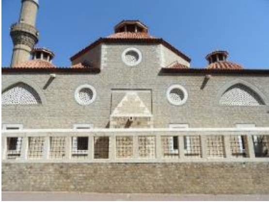
Şekil 3 Antalya Karakaş Camii [13]

birlikte kullanılan malzemeleri tercih ederek “küçüğün güzelliği” olarak tabir ettiği daha mütevazi ve daha göze hitap etmesinin önemini belirtmiştir. Antalya Karakaş Camii plan olarak avlu son cemaat yeri ve iç mekandan oluşmaktadır.