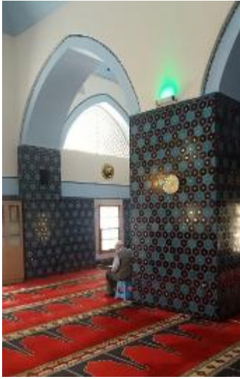
Şekil 4 Antalya Karakaş Camii iç duvarlardaki seramikler [13]

Caminin içinde kullanılmış olan seramikler için artık o dönemin seramiğe karşı önemini yitirmesi üzerine duyarlılığı arttırmak için iç duvarların belli bir seviyesine kadar seramik kaplanmıştır.