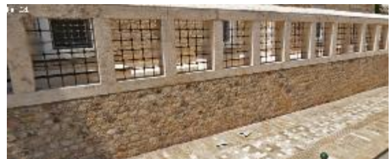
Şekil 2 Antalya Karakaş Camii duvarı [13]

Yıkılan cami dikdörtgen plana sahip ve basit beşik örtüsü kiremitle örtülü bir binaydı [11]. yıkılmış olan caminin planının değiştirilmeme sebebi olarak Turgut Cansever bir röportajında "Gereksiz iddiacılığa düşmemek için" cami planına Antalya Karakaş Camii, Cansever'in Anadolu'nun çeşitli kültür katmanlarını birleştirerek çizdiği bir projedir [12]. Bölgeselcilik kavramının detaylarının belli olduğu bu camide yerel malzemeler kullanılmıştır.