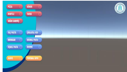
Şekil 4. Ürünlerin farklı renklerde kategorize edilmesi

Vuforia resmi web sitesinden develop menüsüne girilerek ( https://developer.vuforia.com/vui/develop/databases ) add database butonuna tıklanmıştır. Type menüsünden device seçeneği seçilmiş ve bir veritabanı ismi belirlenmiştir. Veritabanı oluşturulup, maksimum 2 megabayt boyutunda png ya da jpg formatında işaretleyici "Add target" butonuna basılarak yüklenmiştir. Oluşturulan işaretleyicinin puanının yüksek olması önem arz etmektedir. Çünkü bu puan, işaretleyicimizin diğer nesnelere ayırt edilebilmesini sağlamakta ve kamera hareketlerinde kopmaları en aza indirmekte önemli bir göstergedir. İşaretleyici oluşturulmuş ve "Download Database" butonuna tıklanarak Unity Editor programı seçilmiştir. Bu seçenek oluşturulan işaretleyicinin hangi platform için kullanılacağını göstermektedir. İndirilen işaretleyici Inspector menüsü altında Image Target ayarını from Database olarak seçilerek kullanılmıştır. Uygulamada içecek ve yiyeceklerin tek bir QR kod işaretleyici ile yansıtılabilmesinden kaynaklı sorunların önüne geçebilmek adına butonlar oluşturulmuştur. Sahnelerin birbirinden ayırt edilebilmesi ve ürünlerin çeşitliliğini simgelemesi bağlamında ana yemekler kırmızı, pasta çeşitleri mavi, içecekler ise sarı renkte oluşturulmuştur (Şekil 4).