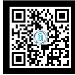
Şekil 3. Oluşturulan İşaretleyicinin Görüntüsü

kodlu işaretleyici kullanılmıştır. QR kodları, hızlı yanıt için tasarlanmıştır ve bir akıllı telefon kamerası kullanılarak okunabilirler. İşaretleyici QR kodları, kullanıcılara bir web sitesine, ürün sayfasına, indirilebilir bir dosyaya veya diğer çevrimiçi kaynaklara yönlendirmek için kullanılabilir. QR kodlarının boyutu ve tasarımı oldukça önemlidir. QR kodlarının kolayca taranabilmesi için yeterli kontrast ve netlik sağlanmalıdır. Bu program için aşağıdaki işaretleyici özel olarak oluşturulmuştur (Şekil 3).