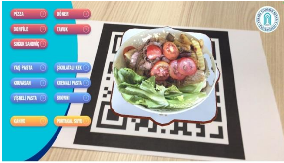
Şekil 5. Uygulama İçi Görüntü

Uygulama dışı aktarılmadan önce farklı ebatlarda ikonlar Illustrator programı aracılığıyla oluşturulmuştur. Android, ios ve tablet cihazlarda bu ikonların görüntülenebilmesi için Unity3D programında Project Settings menüsü altından Player Settings'e girilerek ikonlar uygulamaya dahil edilmiştir. Uygulamayı dışı aktarmak için File menüsünden "Build Settings"e girerek dışı aktarmak istediğimiz platform olan Android seçilmiştir. Dışı aktarılan yazılımın uygulama içi görüntüsü Şekil 5'te gösterilmiştir.