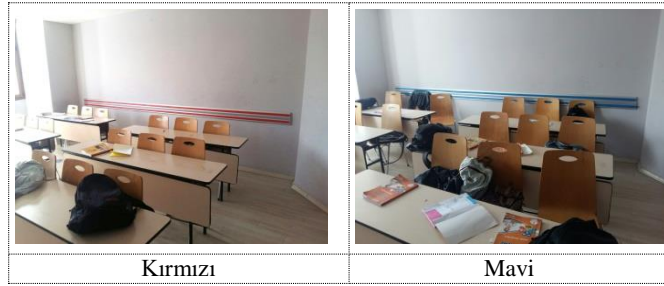
Şekil 1. Araştırmada kullanılan sınıfların fotoğrafları

hafta içi ve hafta sonu dâhil olmak üzere günün farklı zamanlarında uygulanmış ve süreç yaklaşık 30 dakikada tamamlanmıştır. Araştırma kapsamına alınan sınıfların fotoğrafları Şekil 1’de verilmiştir.