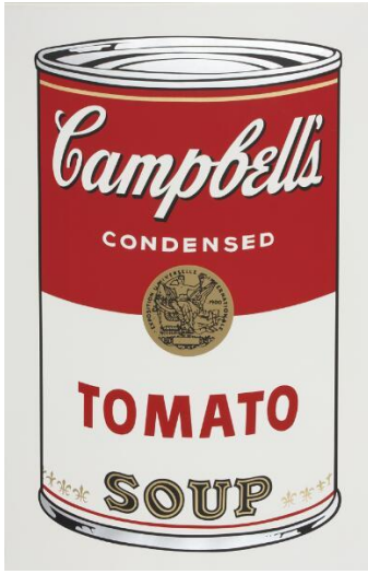
Resim 1: Andy Warhol, Campbell's Soup II, 1969

"Campbell çorba kutularını tuvalde sıra halinde yapmışım ve sonra kutuların üzerine yapılmış kutular elde ettim... Fakat gerçekçi olmadıklarından dolayı gülünç görünüyorlardı. Sadece boyanmış oldukları düşüncesini uyandırıyor, kahverengi ve basit birer kutu olarak görünüyorlardı, bu yüzden sadece sıradan bir kutu yapmanın harika olabileceğini düşündüm." [9]