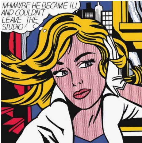
Resim 2: Roy Lichtenstein, Belki, 1965

Yine Pop Art'ın Amerika'da önemli temsilcilerinden biri olan Roy Lichtenstein önceleri soyut dışavurumcu resimler yapıyordu. Zaman içerisinde gazete ve dergilerde yer alan çizgi romanların biçimsel yapılarına ilgi duymaya başladı. Çizgi romandaki kareleri büyülterek kendi biçimsel anlayışıyla kopyalarını oluşturuyordu. Noktacı anlayışla üretim yapan sanatçının çalışmalarında matbaa tramplarını kullandığı görülmektedir.