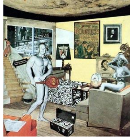
Resim 3: Richard Hamilton, "Bugünün Evlerini Bu Denli Farklı, Bu Denli Cazip Kılan Nedir?", Kolaj, 1956

Tablodaki her şey son derece alaycı ve abartılıdır; modern dünyayı simgeleyen garip eşyalarla dolu bir salonun ortasında kas manyağı olmuş bir adam durmaktadır, elinde muhtemelen halter niyetine taşıdığı dev bir topitop vardır, kanepede ise kafasına abajur geçirmiş çıplak bir arka sayfa güzeli sakın sakın hayallere dalmıştır. O dönem için son derece aykırı bir çalışmadır bu; pek çok insan nefesini tutar ve merakla neler olacağını beklemeye başlar.