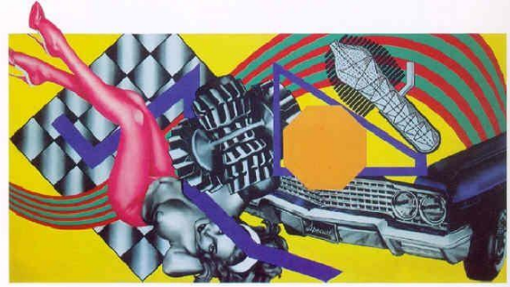
Resim 4: Peter Phillips, "Alışıldık Resim No=5", 1965

İngiltere'de yapılmış bazı Pop eserleri, kişiselleştirmeye bağlı olarak, popüler kültür öğelerini rahatsız edici ve düşündürücü biçimlerde sunar. İngiliz sanatçı Peter Phillips erkeklere yüklenen kurulu rollerin ve reklamlarda kullanılan duygusal algılamaya bağlı yöntemlerin trajik bir abartısını yansıtır. Araba "Alışıldık Resim No=5"de bir cinsellik sembolüdür. [11]