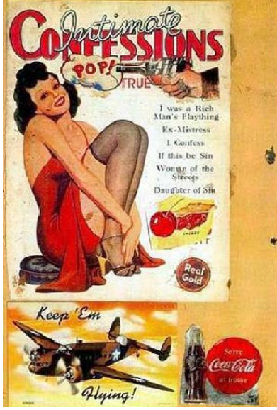
Resim 5: Eduardo Paolozzi, “Zengin Bir Adamın Oyuncagıydım”, 1947