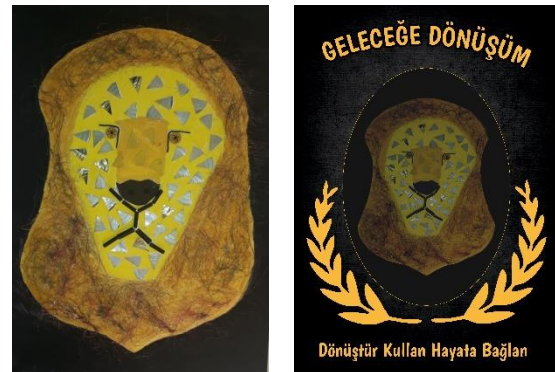
Şekil 7 (a) Atık malzeme