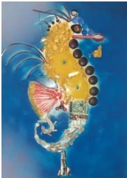
Şekil 10 (a) Atık malzeme