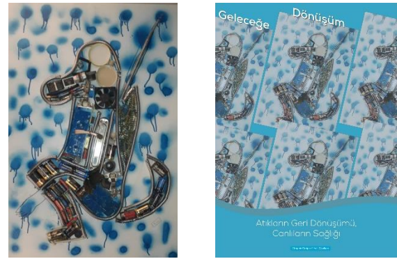
Şekil 5 (a) Atık malzeme