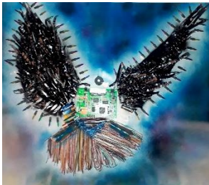
Şekil 11 (a) Atık malzeme