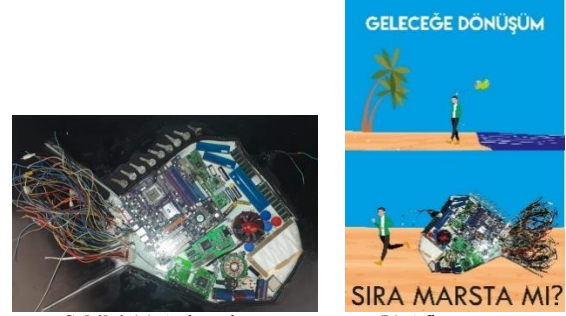
Şekil 4 (a) Atık malzeme

çalışmalar, bilgisayar destekli programlara aktarılıp, tasarımları yapılarak afiş formuna dönüştürülmüştür (Şekil 4-11).