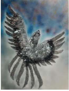
Şekil 8 (a) Atık malzeme