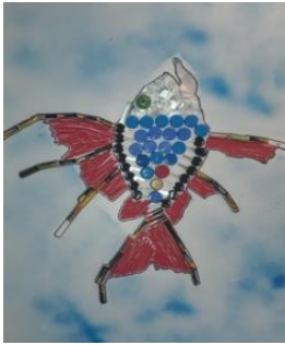
Şekil 9 (a) Atık malzeme