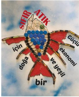
(b) Afiş tasarımı