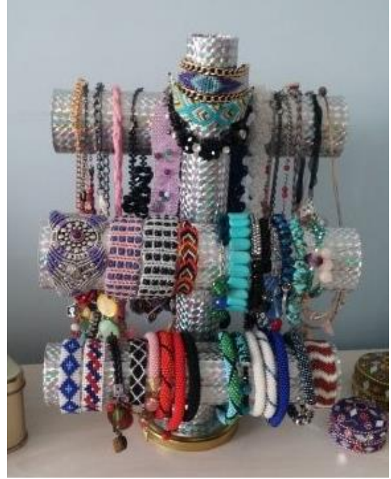
Şekil 2 Atık malzemelerden takı askısı [4]

Örneklerden de anlaşılacağı gibi atık malzeme yaratıcı düşünceler sonucunda sanatsal ürünlere dönüştürülmektedir. Bu sayede hem atık malzemeler değerlendirilecek hem de hızlı tüketim ve geri dönüşüm konusunda istenilen farkındalık oluşturulacaktır.