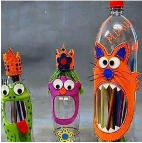
Şekil 1 Atık malzemelerden kalemlik [3]

Günümüzde atık nesne kullanımı, eğitim alanında da ön plana çıkmıştır. Okul öncesi, ilköğretim, ortaokul, lise ve üniversitede sanat eğitimi içerikli derslerde atık malzemeler kullanılarak tasarım yapılmaktadır. Hızlı tüketim sonucu artan atık malzemeler günlük hayatta kullanılabilir objelere dönüştürülmektedir.