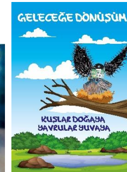
(b) Afiş tasarımı