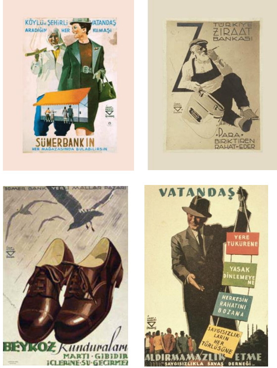
Şekil 3 İ.Hulusi Görey Afişleri [6]

20.yy'da afiş sanatını ülkemize getiren ve çalışmalarıyla döneme imza atan isim İhap Hulusi Görey'dir. 1923 yılında ilk afiş sergisini yapmıştır.