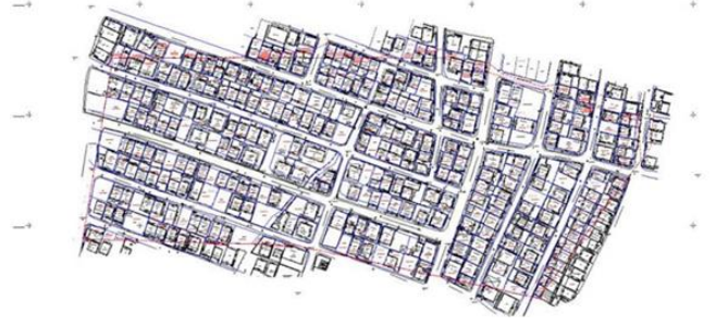
Şekil 3.. Hisseli Parsel Yerleşme Örneği [22]

İmar afları ile kamu kontrolü dışında sağlıklı gelişen alanlar, geçen 50-60 yıllık sürede bir önceki sorunun üzerine inşa edilerek büyümüşür. Kentin doğal ve fiziksel karakteri ile uyumsuz, afet risklerine karşı dirençsizdir. Hazine arazileri uygun bedellerle yapılaşmaya açılmıştır. İmar mevzuatı ve planlara aykırı yapılar affedilmiştir. Arka arkaya çıkarılan tüm af yasaları daha geniş kapsamlı ve toleranslıdır ve buna bağlı olarak mevzuata aykırı yapıların yasaklandığı belirtilmesine 143ontro kaçak yapılanmaya engel olunamamış, yapı yoğunlukları ise yatay ve düşeyde artış göstermiştir. Yasaların uygulamaları, 143ontro alanlarının geliştirilmesi artırılması yönünde katkı sağlamamıştır.