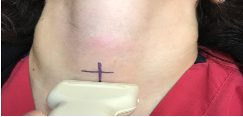
RESİM 3. Ultrasonografi ile trakeostomi iğne giriş yerinin işaretlenmesi.