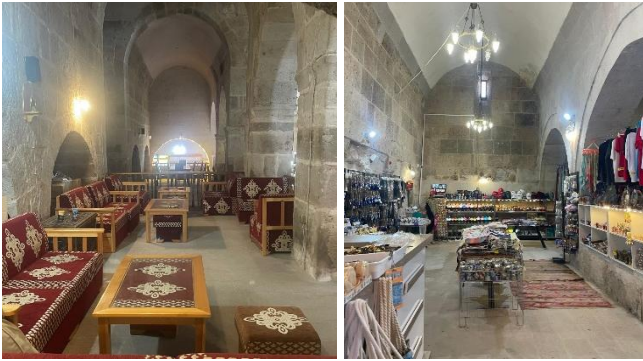
Şekil 3. Mola durak noktası işlevli kullanılan kervansaray örnekleri (Öresin Han, Alay Han, [16])

Çalışma kapsamındaki 9 adet kervansarayın literatürde adı geçmesine ve Çekül ipek yolu haritasında yerleri işaretlenmiş olmasına rağmen günümüze ulaşmadıkları saptanmıştır. 8 adet kervansaray bir duvar kalıntısı şeklinde günümüze ulaşmıştır. 2 adet yapı ise plan şemaları okunacak şekilde harabe halinde varlığını sürdürmektedir. Bu kervansaraylar; Kargı Han ve Eğirdir Han'dır. 14 adet yapı ise son dönemlerde gerçekleştirilen bütünlendirme niteliğindeki restorasyon çalışmaları ile günümüzde bir bütün olarak algılanmaktadır. Bu veriler değerlendirildiğinde yapısal durumları bakımından incelenen yapıların %42'si iyi durumda oldukları tespit edilmiştir. Günümüzde mevcut olmayan yapılar %27'lik dilimle azımsanmayacak yoğunluktadır. Kalıntı yapıların oranı % 24 iken bütünlüğünü önemli oranda yitirmiş yapılar ise çalışma kapsamındaki yapıların %6'sını oluşturur.