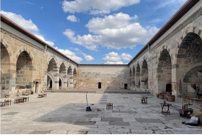
Şekil 2. Yapısal durumu iyi olan kervansaray örneklerinden, Zazadin Han, [16]

Çalışma kapsamındaki 9 adet kervansarayın literatürde adı geçmesine ve Çekül ipek yolu haritasında yerleri işaretlenmiş olmasına rağmen günümüze ulaşmadıkları saptanmıştır. 8 adet kervansaray bir duvar kalıntısı şeklinde günümüze ulaşmıştır. 2 adet yapı ise plan şemaları okunacak şekilde harabe halinde varlığını sürdürmektedir. Bu kervansaraylar; Kargı Han ve Eğirdir Han'dır. 14 adet yapı ise son dönemlerde gerçekleştirilen bütünlendirme niteliğindeki restorasyon çalışmaları ile günümüzde bir bütün olarak algılanmaktadır. Bu veriler değerlendirildiğinde yapısal durumları bakımından incelenen yapıların %42'si iyi durumda oldukları tespit edilmiştir. Günümüzde mevcut olmayan yapılar %27'lik dilimle azımsanmayacak yoğunluktadır. Kalıntı yapıların oranı % 24 iken bütünlüğünü önemli oranda yitirmiş yapılar ise çalışma kapsamındaki yapıların %6'sını oluşturur.