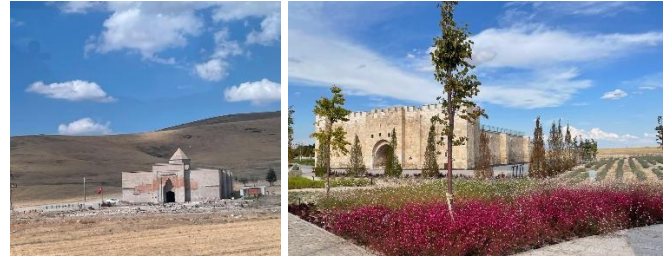
Şekil 5. Yerleşim dışında konumlanan kervansaray örnekleri (Alay Han, Obruk Han, [16])

Geçici miras listesindeki kervansaraylar günümüzdeki konumları bakımından da araştırılmıştır. Yapısal olarak varlığını sürdüren 24 adet kervansarayın 14 adedi herhangi bir yerleşim içinde yer almamaktadır. 10 adet kervansaray konumu itibarıyla yerleşimin var olduğu bir dokuda bulunmaktadır. Bu veriler ışığında % 58 oranında kervansaray yapısının yerleşim dışında, kentsel dokudan izole bir konumda yer aldığı ortaya çıkmaktadır. Bu bağlamda % 42 oranındaki kervansarayların ise kent içi hanı konumunda olduğu söylenebilir.