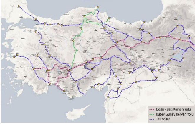
Şekil 1 Anadolu kervan yolları ([6] üzerine yazarlar tarafından işlenmiştir.)

çevreleyen mekânlarda insanlar; kışın kapalı bölümdeki sekilerde insanlar, sekiden daha alt kotta bulunan zeminde hayvanlar olmak üzere insanlarla hayvanlar birlikte konaklardı [3]. Kervansaraylara gelen yolcular herhangi bir ücret ödemeksizin üç gün kervansarayda kalabilir ve bütün ihtiyaçlarını giderebilir olmaları, sosyal devlet anlayışının da bir göstergesidir. [4] Erken dönem Anadolu Türk mimarisinin örnekleri olan kervansaraylar, 13. yüzyılda Anadolu'nun sosyal ve ekonomik yapısını, kültürel ve fiziksel çevrede oluşan sentezin aşamalarının izlerini taşıyan yapılardır [5].