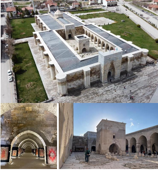
Şekil 6 Yerleşim içinde konumlanan ve müze işlevli Aksaray Sultan Han, [16], [17]

dışında yer alan ve işleve sahip kervansarayların %60'ı günümüzde mola işlevli durak yapıları olarak kullanılmaktadır.